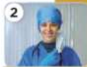
a farmer / no