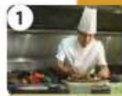
a cook / yes