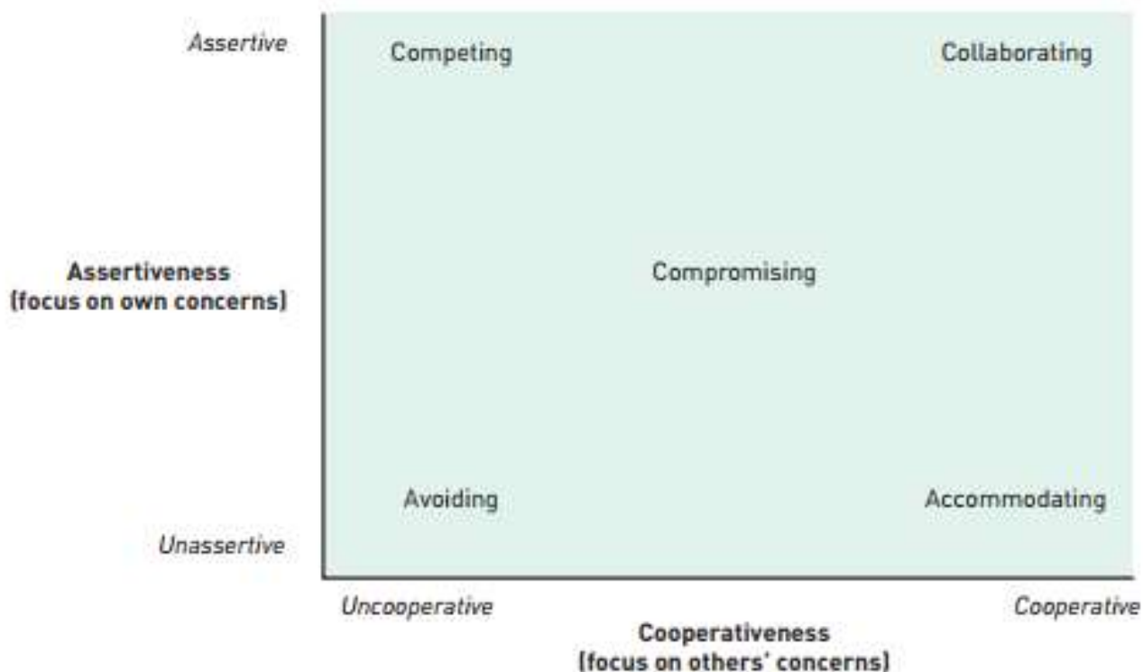
Figure 5.1 A model of conflict-handling styles